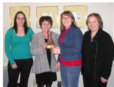
Les employés de l'Agence de santé

Merci à toutes ces entreprises et organisations qui nous ont ouvert leur porte avec empressement et générosité. Mais surtout, félicitations à tous ces travailleurs qui nous ont ouvert la porte de leur cœur, qui ont donné avec générosité et qui se sont empressés de joindre ainsi cette grande chaîne d'entraide et d'amour.