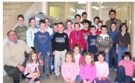
Les élèves de l'école Leventoux ont participé à la campagne 2008 en amassant des bouteilles.

L'édition 2009 aura lieu le mercredi 13 mai prochain. Pour les écoles Leventoux (59 élèves) et St-Cœur-de-Marie de Baie-Comeau ( 36 élèves).